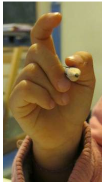
points bleus droitiers Points bleus pour